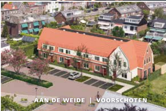
AAN DE WEIDE | VOORSCHOTEN

WIJ WERKEN ER HARD AAN OM MET DEZE EN ANDERE PROJECTEN VOORSCHOTEN NOG MOOIER TE MAKEN