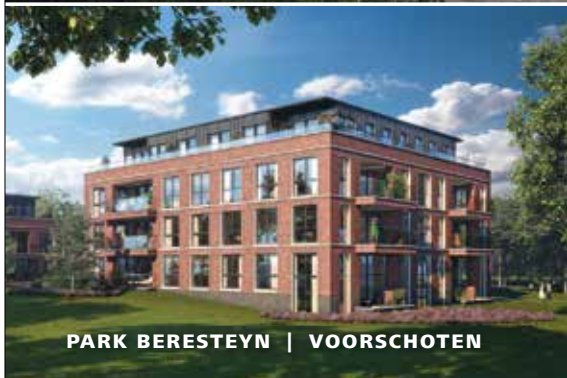
PARK BERESTEYN | VOORSCHOTEN