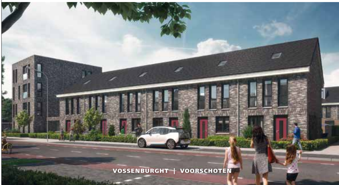
VOSSENBURGHT | VOORSCHOTEN